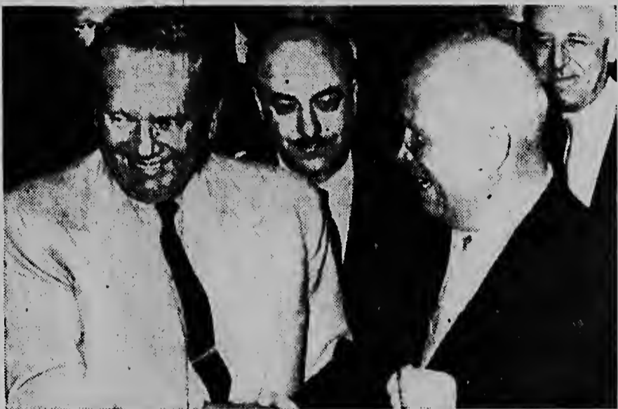
Premier Krushev y president Tito ta saluda otro cordialmente prome cu e asamblea general di Nacionnan Uni a cumenza.

Krutshef a bisita MacMillan Prome ministro Krutshef a bisita prome ministro MacMillan pa 1 1/2 ora, riba su mes peticion. Un portavoz ingles a bisa cu nan a discuti casi solamente e problema di